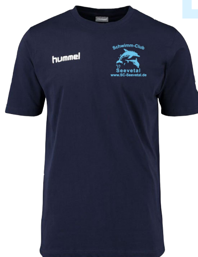
Hummel Core Polyester Tee Marine inkl. SC Seevetal Logo Herzseite Art. 003756-7026 (Erwachsene) Art. 103756-7026 (Kinder) für Erwachsene 15,50€ für Kinder 14,00€