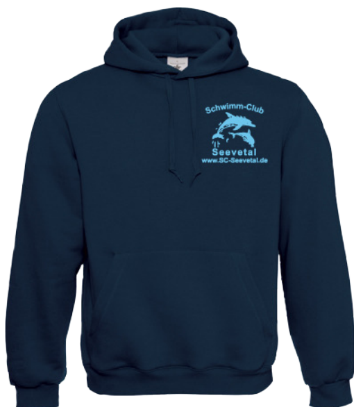
B&C Kapuzensweat navy inkl. SC Seevetal Logo Herzseite Art. BCWU620 (Erwachsene) Art. BCWK681 (Kinder) für Erwachsene 26,00€ für Kinder 21,00€