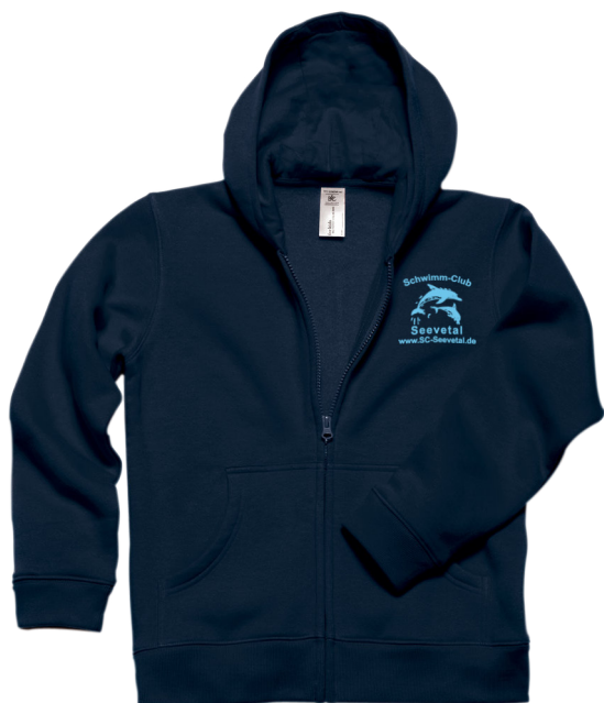
B&C Kapuzenjacke navy inkl. SC Seevetal Logo Herzseite Art. BCWM647 (Erwachsene) Art. BCWK682 (Kinder) für Erwachsene 28,50€ für Kinder 24,50€