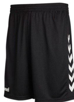
Hummel Core Polyester Short Art. 011083-2001 (Erwachsene) Art. 111083-2001 (Kinder) Art. 011086-2001 (für Damen) Preis für Erwachsene 10,50€ für Kinder 9,50€

Auf allen Textilien ist es möglich, den Namen für 4,50€ in hellblau aufzubringen.