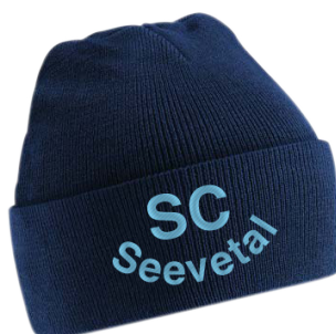
Beechfield Wintermütze inkl. besticktem Schriftzug Art. CB45 Preis für 9,90€